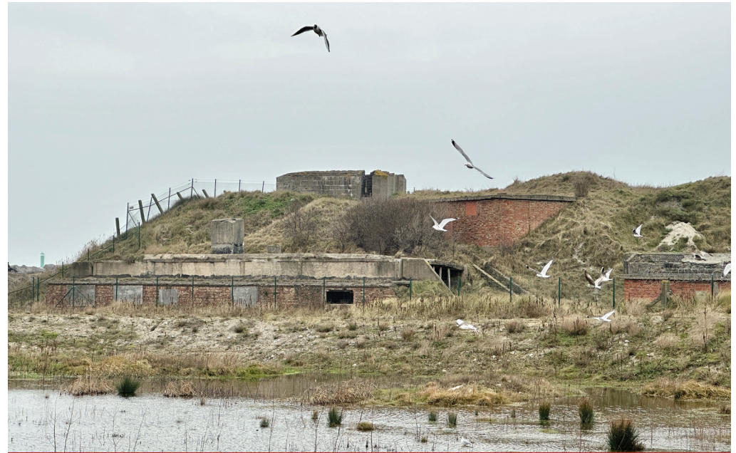
Eine alte Verteidigungsanlage am Meer, an der dieser Weg vorbeiführt