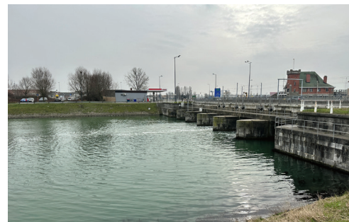
Hafen / Spuikom Oostende