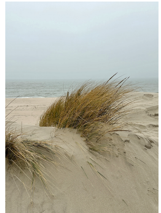
Entlang vom Strand und Meer