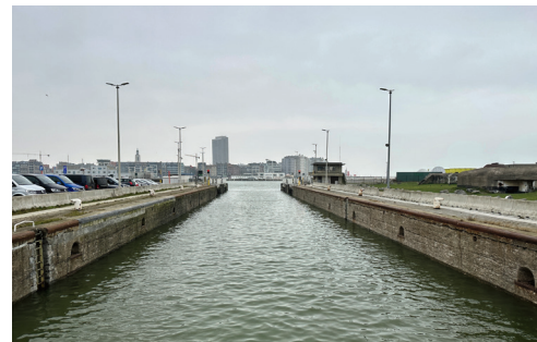
Durch das Hafengebiet Oostende