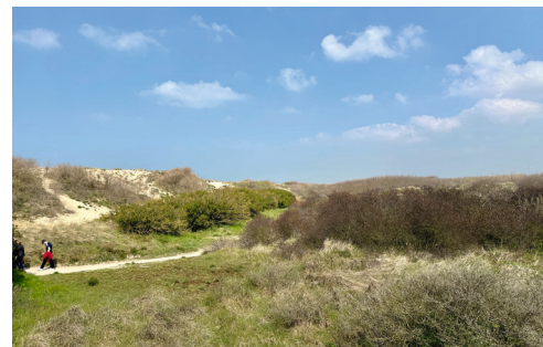
Ein Abschnitt verläuft durch die Dünen