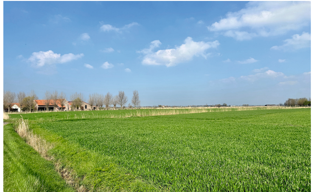
Über große Abschnitte verläuft der Weg an Feldern und Höfen vorbei