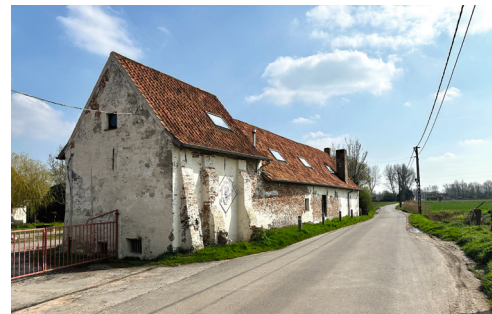
Ein alter Hof am Wegesrand